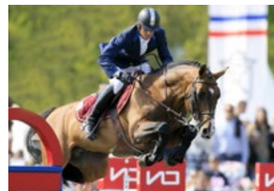
Son père, Quaprice Grand gagnant en CSIO

SON PÈRE, Quaprice Bois Margot est un grand gagnant CSIO : Grand Prix CSI5* d'Arrezzo, Grand Prix CSI5* Global Tour d'Hambourg, 10 ème Grand Prix CSIO de la Baule. A 8 ans, il est le Meilleur étalon de la ranking list mondiale FEI, 3 e du Championnat du Monde des étalons.