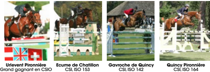
Urlevant Pironnière Grand gagnant en CSIO Ecume de Chatillon CSI, ISO 153 Gavroche de Quincy CSI, ISO 142 Quincy Pironnière CSI, ISO 164

SA 3 ème MERE OPERA IV est la propre sœur de La Pironnière, grande gagnante en CSI, ISO 164. Elle a produit Accius Pironniere, finaliste à 6 ans, Ibis Pironniere, Finaliste à 6 ans, ISO 133