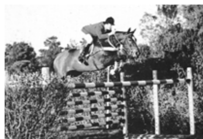
Sa 4 ème Mère : Electre II Grande Gagnante internationale avec H. Godignon

SA 3 ème MÈRE, Belle Little, est une fille de Quidam de Revel. Elle a également produit Hold Up Premier, étalon en Hollande, gagnant international, 2 ème du Derby de Valkenswaard, 4 ème du Derby de Eindhoven, 6 ème du Sires of the World de Lanaken, 8 ème du Derby de la Baule. Elle a aussi produit Free Of Tax, finaliste des Championnats du Monde de Lanaken à 5 ans.