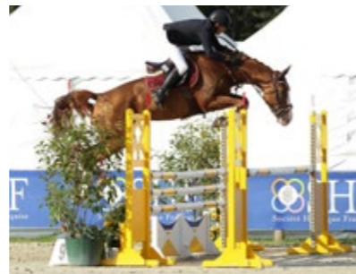
Qidimieux montée de garrot et technique parfaite.

« Qidimieux a tout d'une star : montée de garrot, puissance, souplesse et le célèbre passage de dos de son père Qlassic. Incontestablement, Qidimieux galope sur les traces de son père Qlassic » Rodolphe Bonnet.