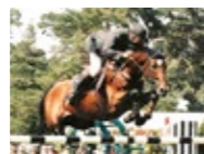
Flushing CSIO Fils de la célèbre Electre